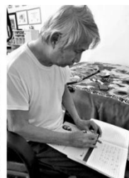
Tập viết trên giấy