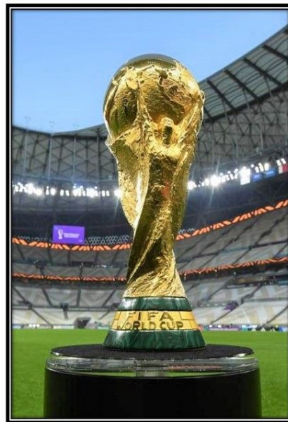
Fifa World Cup Trophy

Chiếc Jules Rimet đã thay thế bằng chiếc cúp “FiFa World Cup” vào năm 1974 khi giải World Cup được tổ chức tại Hoa Kỳ. Đội vô địch không được giữ vĩnh viễn chiếc cúp được