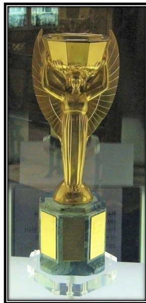
Jules Rimet Trophy

Đó là World Cup đầu tiên do FiFa tổ chức vào mùa hè năm 1930 tại thành phố Motevideo của nước Uruguay với 13 đội tuyển. Uruguay giành chức vô địch và nhận chiếc cúp Jules Rimet Trophy là tên của vị chủ tịch FiFa có công thành lập giải World Cup. Chiếc cúp được mạ vàng trên nền bằng bạc, cao 35 cm. Cúp mang hình tượng nữ thần chiến thắng Nike của Hy Lạp cổ đại nâng chiếc cốc có hình bát giác. Cúp này được trao cho các đội vô địch kể từ năm 1930 cho đến năm 1970. Sau khi ba lần vô địch 1952 - 1962 - 1970 Brazil được giữ cúp vĩnh viễn. Sau đó Brazil lại giành chức vô địch năm 1994 và 2002. Vào năm 1983 chiếc cúp Jules Rimet bị đánh cắp đến nay vẫn chưa tìm lại được.