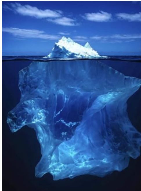
băng thạch trên biển

Một nhà báo nêu câu hỏi duy nhất Về sự an toàn của cuộc hải hành Thomas Andrews ngạo mạn trả lời nhanh “Đến Thượng Đế cũng không nhận chìm nó được!” Thượng Đế tối cao, không chấp lời hỡn xược! Nhưng rủi ro, chứng quả lễ vô thường. Titanic ra giữa Đại Tây Dương Đêm 14/4/1912 chẳng may gặp tai biến