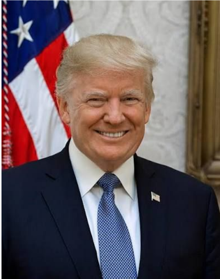
Tổng Thống Trump

Tỉ như thủ tướng Lý Quang Diệu đã làm Tân Gia Ba từ một làng chài thành một quốc gia mà thu nhập đầu người cao hơn nhiều nước Tây Phương.