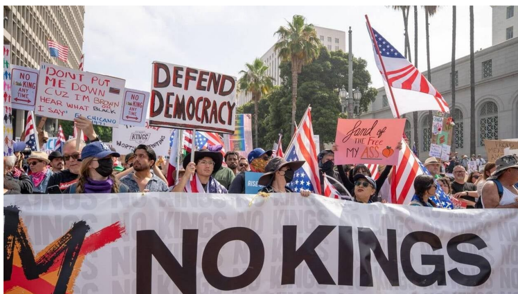
Biểu tình chống Tổng Thống Trump