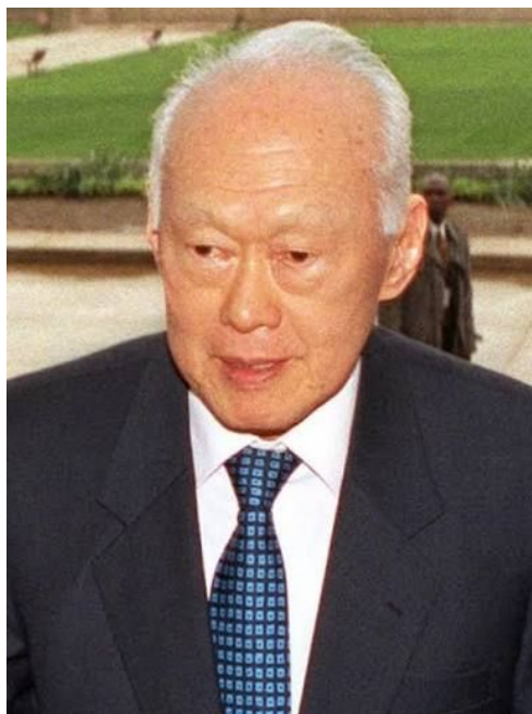
Thủ Tướng Lý Quang Diệu

Thời cận đại và hiện đại trong các chế độ dân chủ, tuy không còn vua, nhưng nếu người lãnh đạo làm đất nước giàu có hay hùng cường thì cũng có thể nói đó là một vị minh quân.