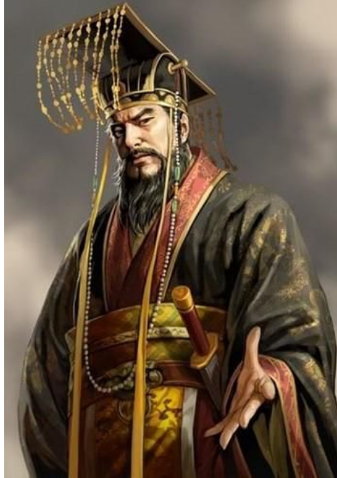
Tần Thủy Hoàng

Thời cận đại và hiện đại trong các chế độ dân chủ, tuy không còn vua, nhưng nếu người lãnh đạo làm đất nước giàu có hay hùng cường thì cũng có thể nói đó là một vị minh quân.